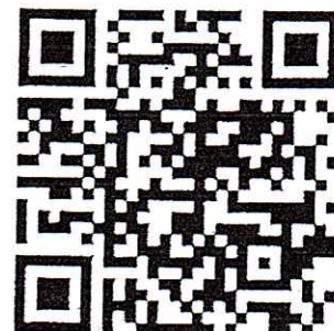
สแกน QR Code ชุดที่ ๒ ความรู้ความเข้าใจในการรับวัคซีนและ การปฏิบัติตนหลังการรับวัคซีนโควิด 19